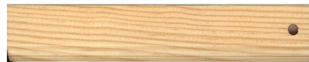
Verni Incolore OO2 tarif B